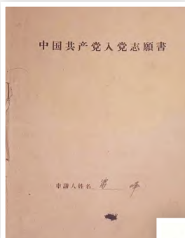
雷锋的入党志愿书